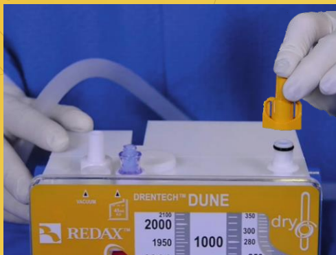
Одноразовый колпачок-заглушка для системы