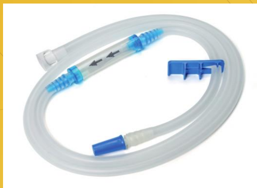
Трубка для новорожденных