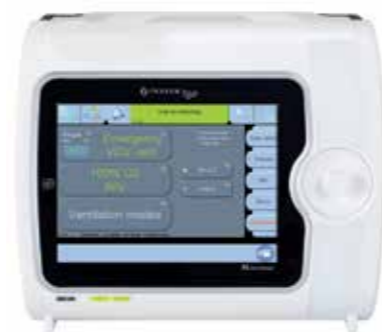
Автоматическая экстренная вентиляция