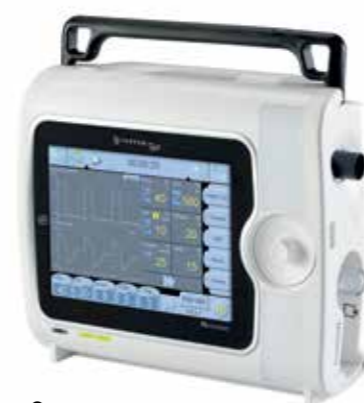
Эргономичная рукоятка и ручка для переноски