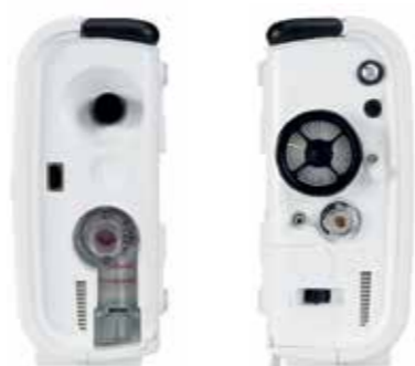
Сгруппированные и локализованные блоки подключений