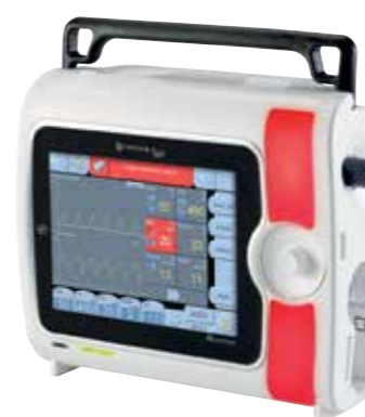
Световая панель сигнализации